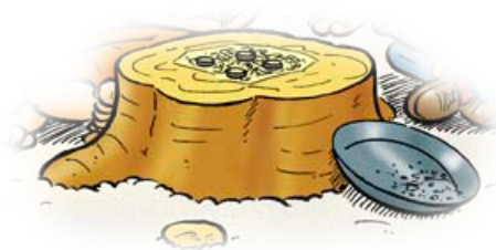
Illustration: Bernd Natke

Wohl um das Gold erschluget ihr mich: Weh' euch! Ihr seid verloren wie ich. Auch ich, ich wollte den Schatz allein, Und mischte euch tödliches Gift an den Wein."